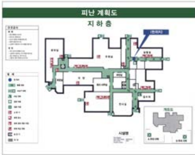
KSSISO 23601:2014, A.2 방향 화살표가 있는 피난 계획도의 사례

참조표준: KSSISO 23601:2014, 안전 식별—피난 및 대피 계획 표지 2014. 9. .